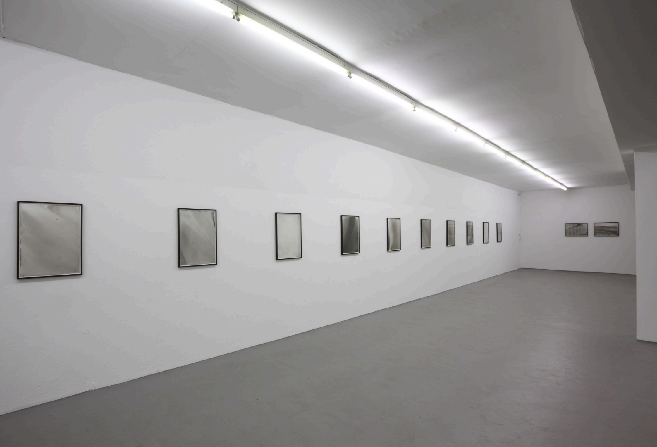
Raumansicht Reich voller Könige, Ausstellung Opener, Koelnberg Kunstverein 2012/ Installation view of Kingdom of Kings, Exhibition Opener, Koelnberg Kunstverein, 2012