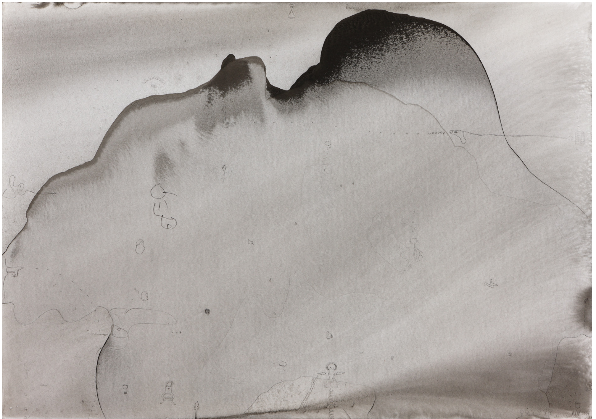
Das Nullpunktfeld, 42 x 59,4 cm, Tusche auf Papier, 2012/ The Zero Field, 42 x 59,4 cm, ink on paper, 2012