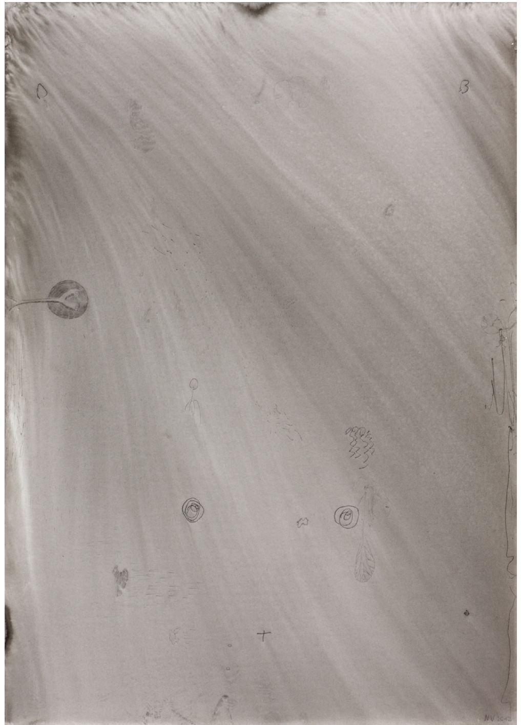
Female Horse, 59,4 x 42 cm, Tusche auf Papier, 2012/ Female Horse, 59,4 x 42 cm, ink on paper, 2012