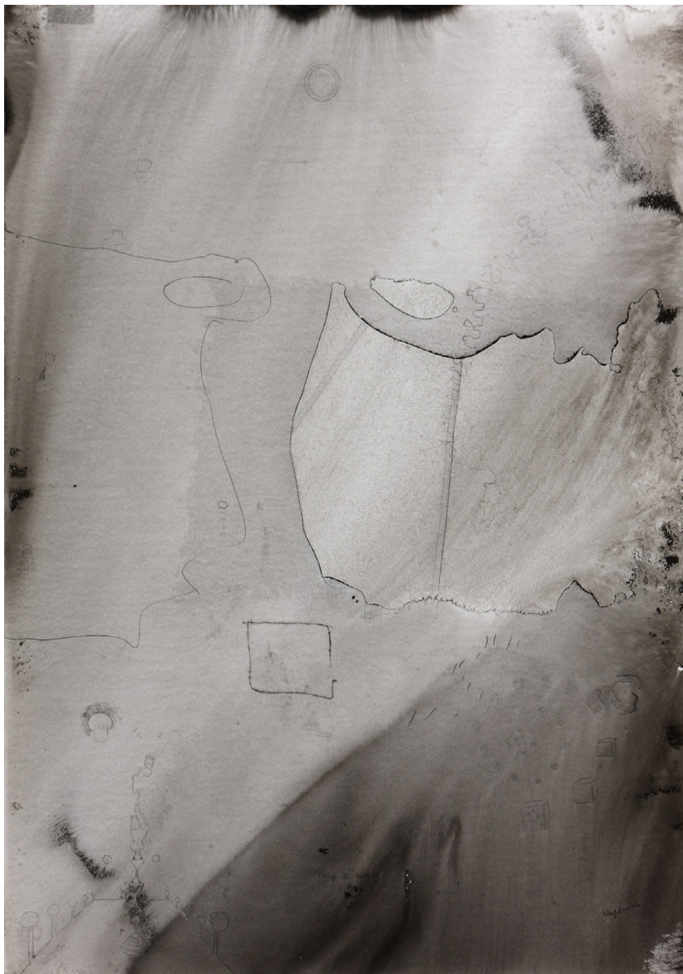
Könige der Welt, 59,4 x 42 cm, Tusche auf Papier, 2012/ Kings of the World, 59,4 x 42 cm, ink on paper, 2012