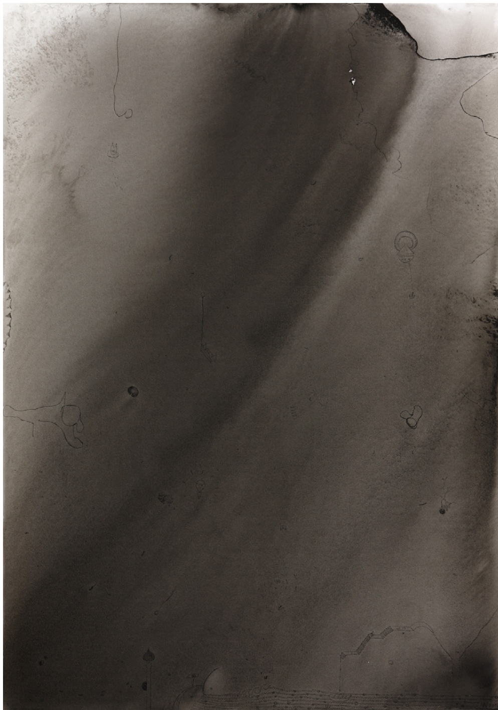
Eyes of the ocean, 59,4 x 42 cm, Tuschke auf Papier, 2012/ Eyes of the ocean, 59,4 x 42 cm, ink on paper, 2012