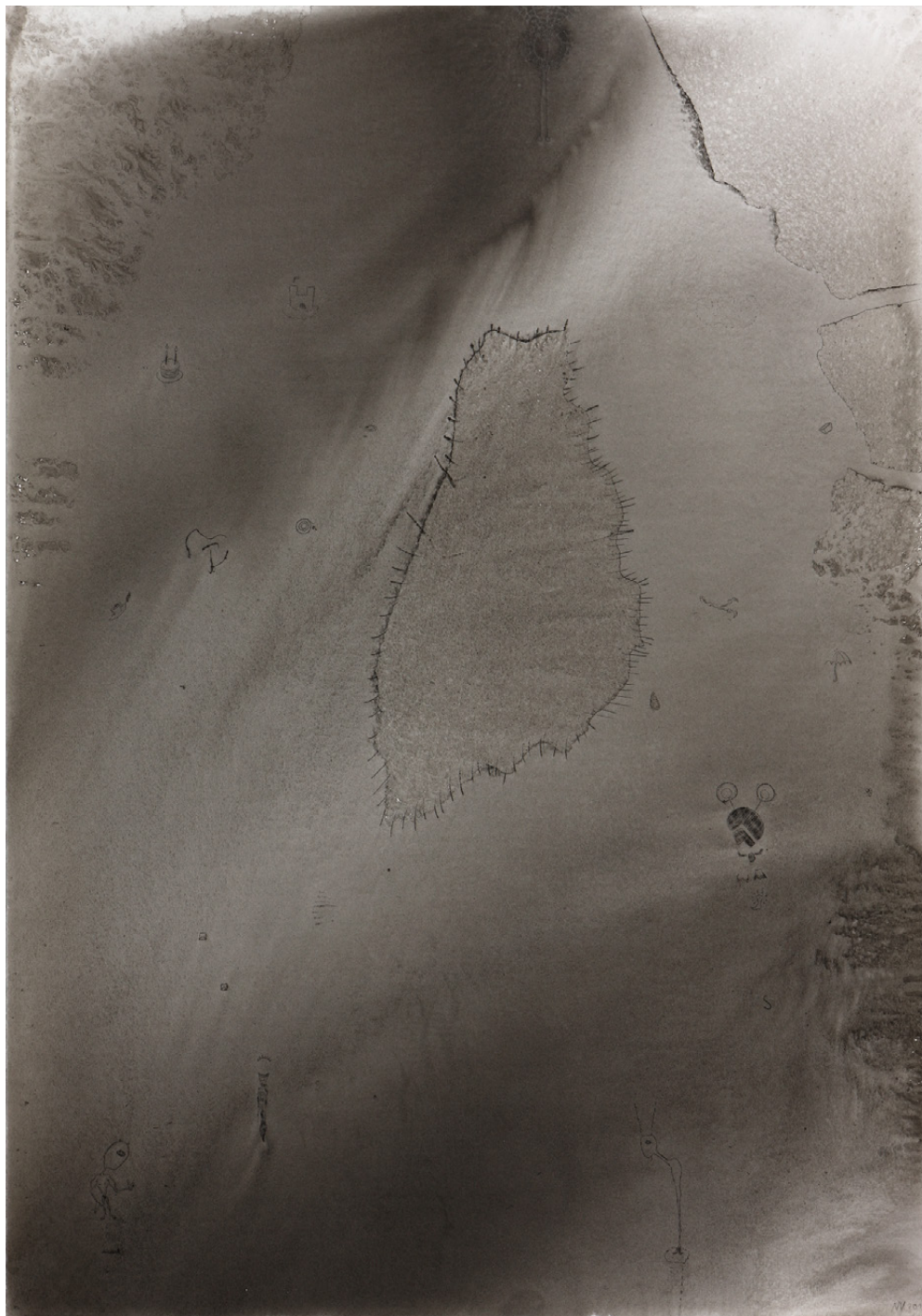
Maserat, 59,4 x 42 cm, Tusche auf Papier, 2012/ Maserat, 59,4 x 42 cm, ink on paper, 2012