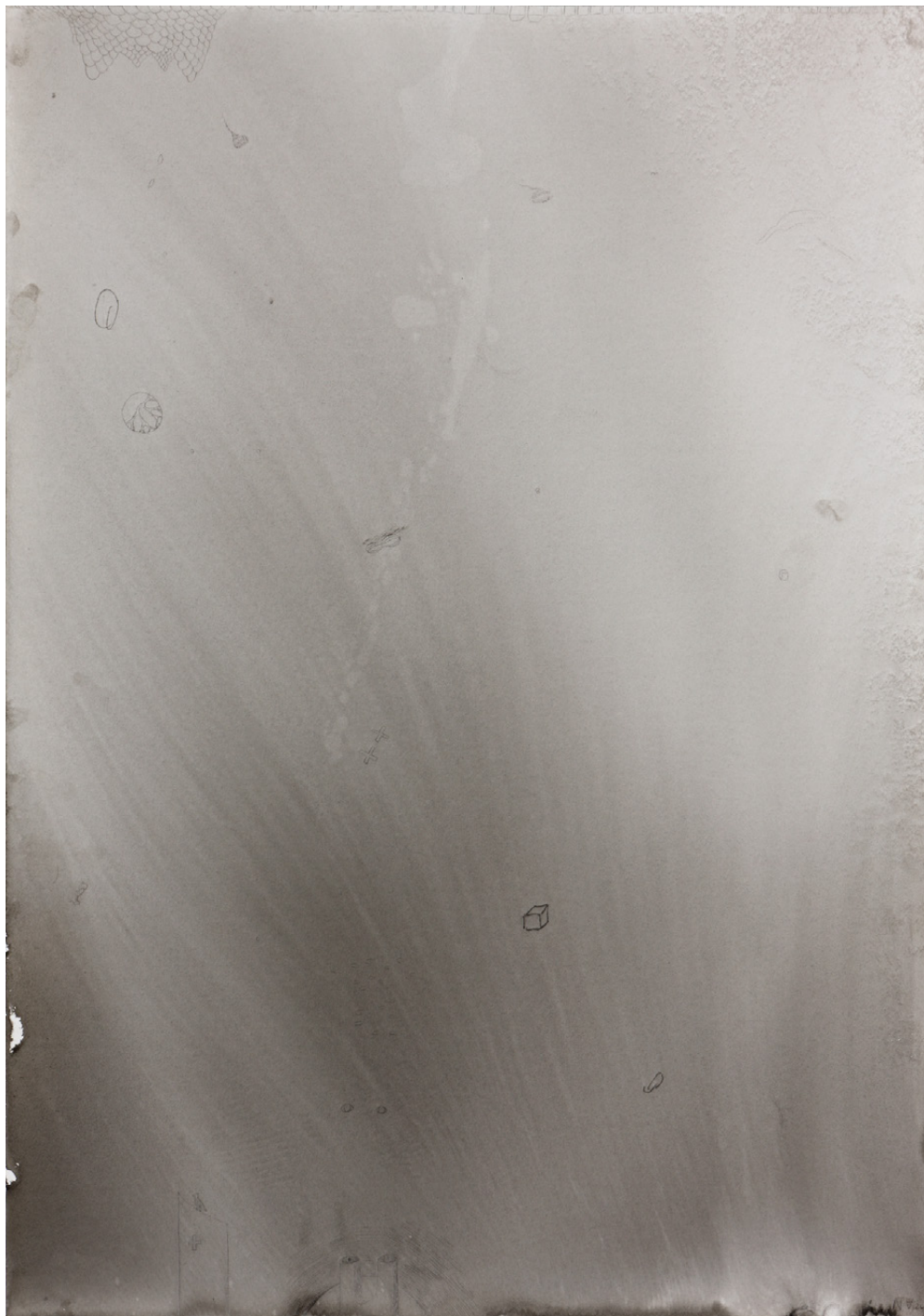
Heilige Erdnuss, 59,4 x 42 cm, Tusche auf Papier, 2012/ Holy Peanut, 59,4 x 42 cm, ink on paper, 2012